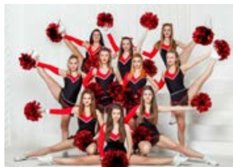
РАГУ ИЗ ЧЕРЛИДИРОВ