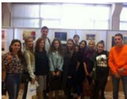
ГЛАВНЫЕ В РАГУ