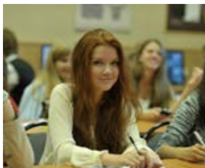
РАГУ ДЛЯ УМНЫХ